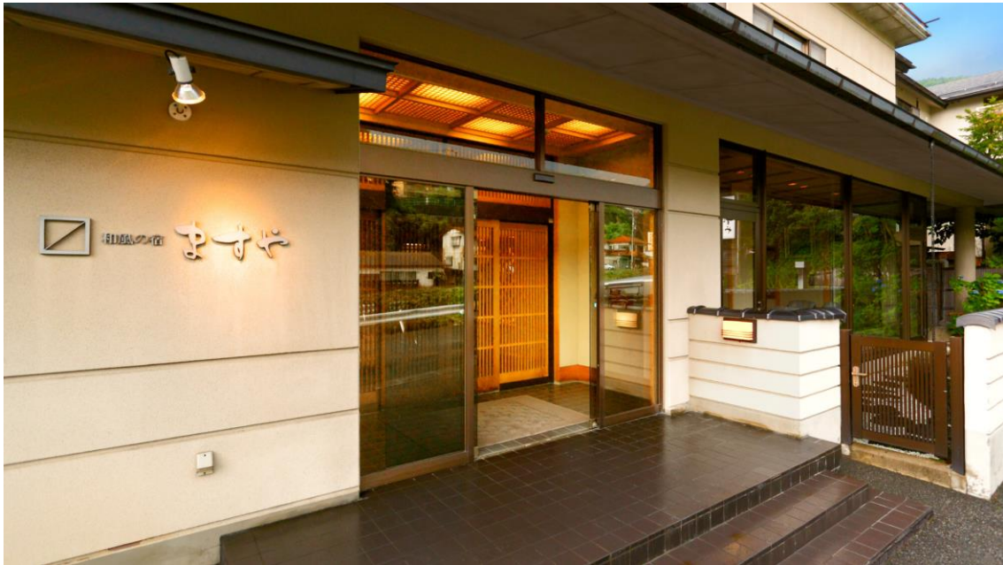
湯田中温泉街の一角にある、100%天然温泉掛け流しの宿『和風の宿 ますや』